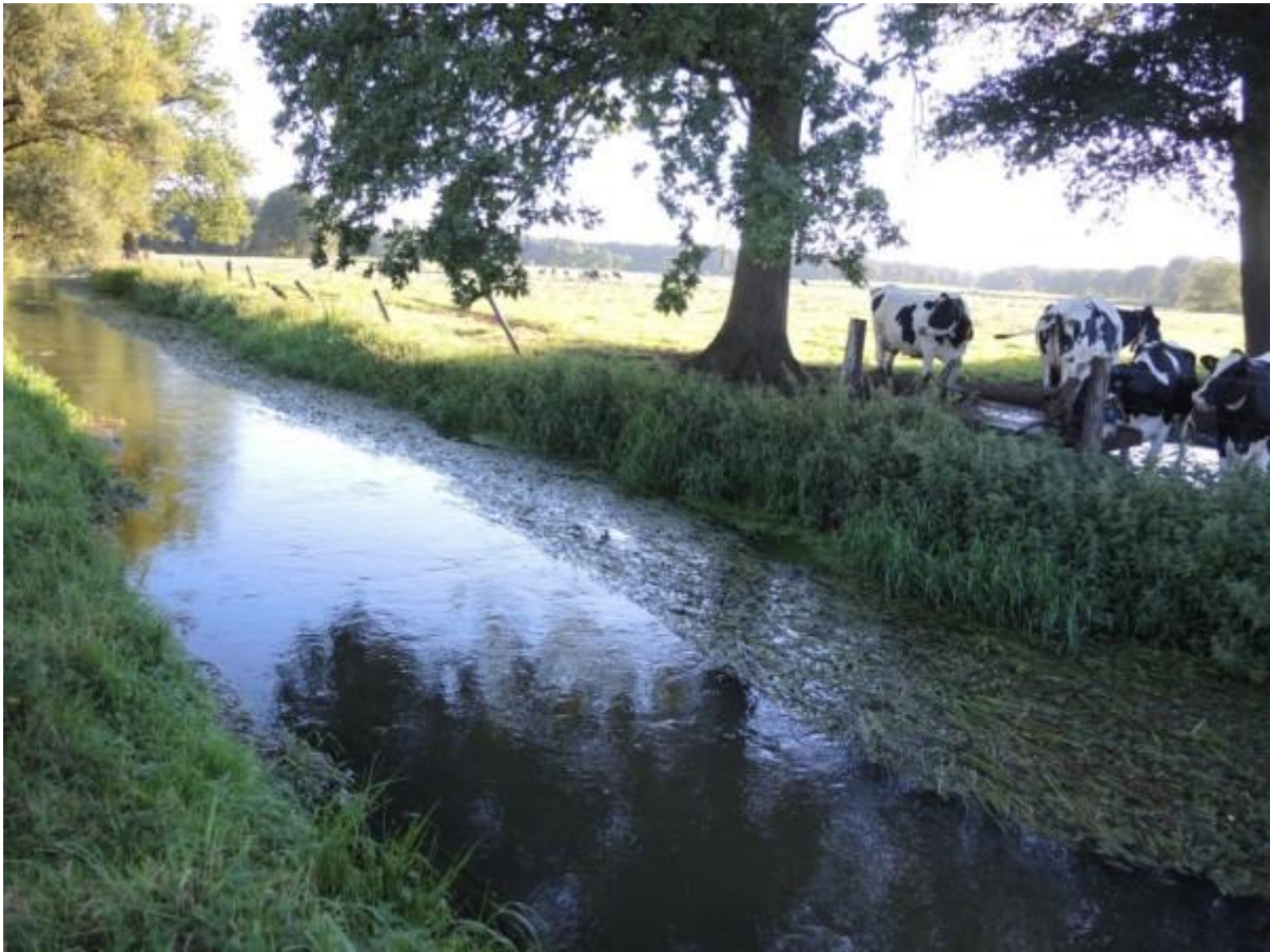
En een kabbelende beek