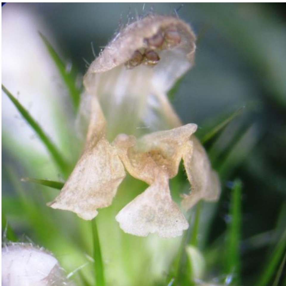
De gespleten hennepnetel